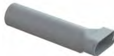
Kryt vývodu vzduchu pro napojení Renoventilu na ComfoTube Flat 51