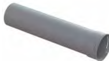
Kryt vývodu vzduchu pro napojení Renoventilu na ComfoTube 1 x DN 90