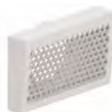
Odtahový Renoventil, hranatý