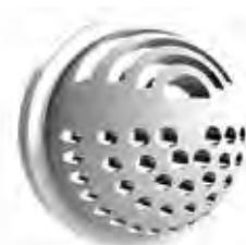
Přívodní Renoventil, kulatý

K napojení na vzduchovody Zehnder Flat51 a ComfoTube 90 se používá příslušný kryt vývodu vzduchu.